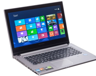
Geräte für den Informatikbereich