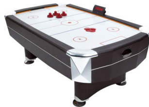
Spielgeräte für die Mittagspause